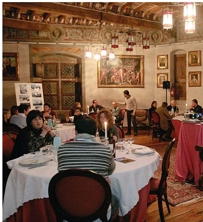
L'interno di un ristorante: un settore che non brilla nel Modenese

Commercio all'ingrosso: +0,1% . Rallenta, dopo alcuni trimestri decisamente positivi, il settore che chiude con un saldo di sostanziale stabilità.